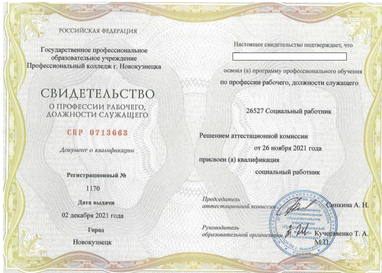
Приложение 1 Форма свидетельства